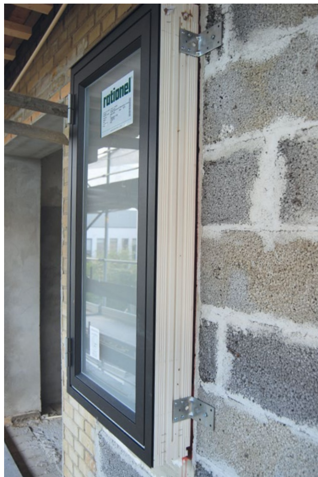
Nyt vindue på nordfacaden af ejendom fra 1970-71

Ved samtidig efterisolering af sokkel opnås yderligere besparelser for reduktion af linietab i samling mellem ydervæg og sokkel. Se energiløsningen ”Efterisolering af sokkel”. Det samme gælder hvis kældervæggen også isoleres udefra.