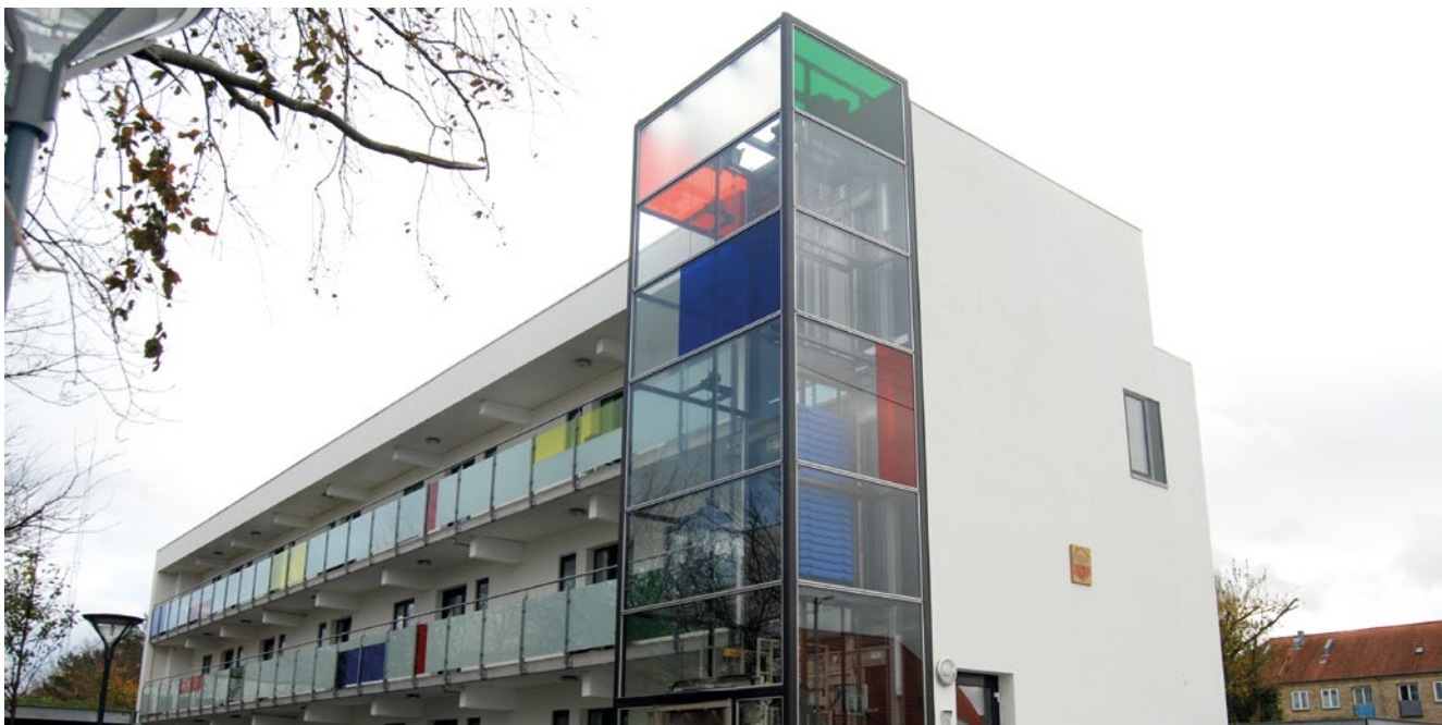
Udvendig facadeisolering med puds på ydervæg med både massive og hulmursisolerede vægge på ejendom fra 1970-71

Den anden mulighed er at anvende et efterisoleringssystem med stiv isolering fastholdt med dybler og afsluttet med puds. Isoleringen kan i dette tilfælde godt være i et lag med omhyggeligt udførte samlinger.