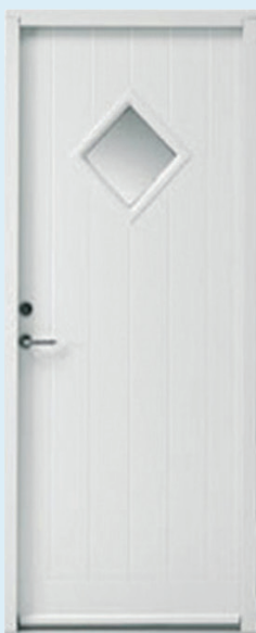
Mindre end 20% rudeandel