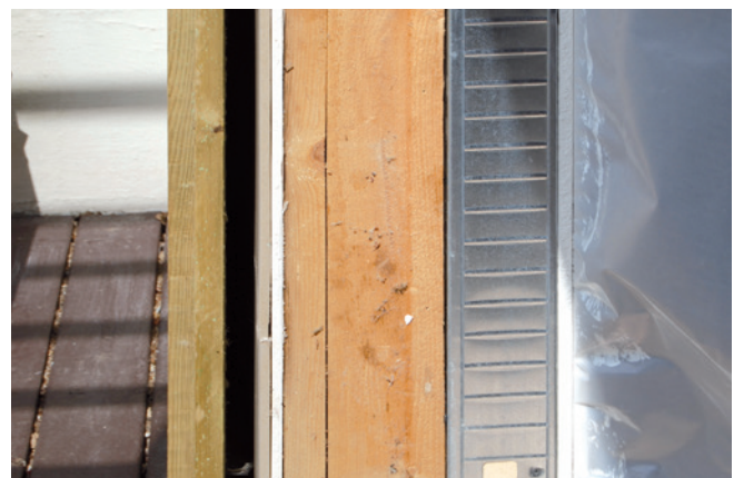
Efterisolering af let ydervæg udført før BR15. Konstruktion set fra ydersiden (venstre): Regnskærm af brædder, hulrum, vindgips, eksisterende træskelet incl. 100-125 mm isolering, ny indvendig isolering i stålskelet, dampspærre og gipsplader.

Dampspærren kan placeres op til en tredjedel inde i den samlede isoleringstykkelse fra den varme side. Det muliggør indbygning af stikdåser mm uden, at dampspærren gennembyrdes.