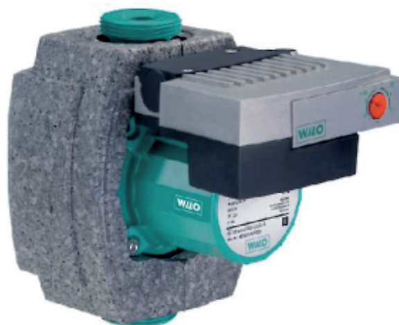
Pumpe med isoleringskappe