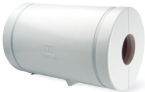
Rørskål afsluttet med plastkappe

Hvis der ikke findes isoleringskapper til de pågældende ventiler og pumper, kan isoleringen udføres med lamelmåtter og pladekapper.